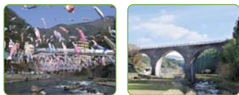
わいた温泉パビリオン 北里パビリオン