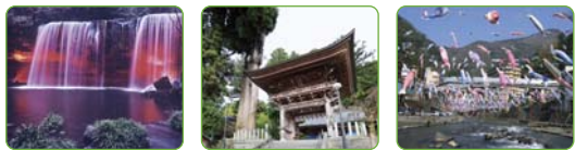
黒淵パビリオン 宮原商店街パビリオン 杖立温泉パビリオン