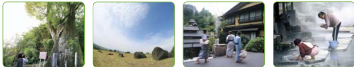
市原商店街パビリオン 中原パビリオン 黒川温泉パビリオン 満願寺パビリオン