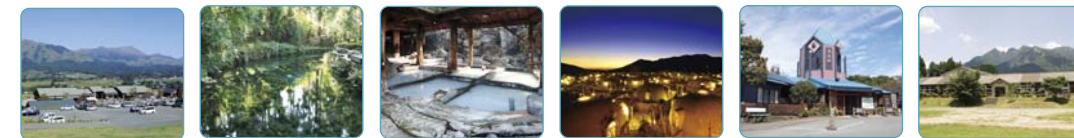
久石パビリオン 白川パビリオン 下田・長野パビリオン 赤水登山道パビリオン 高森商店街パビリオン 根子岳山麓パビリオン