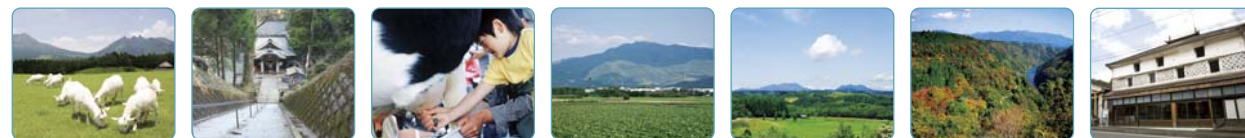
らくだ山山麓パビリオン 奥阿蘇高原パビリオン 阿蘇ミルク牧場パビリオン 萌の里パビリオン そよ風パークパビリオン 蘇陽峡パビリオン 馬見原パビリオン