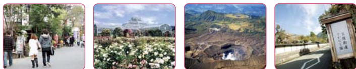
阿蘇神社門前町パビリオン 内牧温泉パビリオン 阿蘇火山パビリオン 坂梨宿場町パビリオン