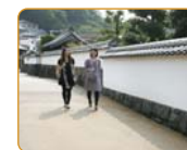
竹田城下町パビリオン