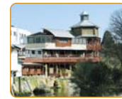
長湯温泉パビリオン